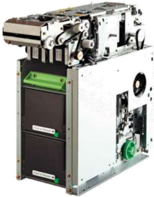
F56 El dispensador de billetes

Alto Rendimiento Múltiple Casete Dispensador